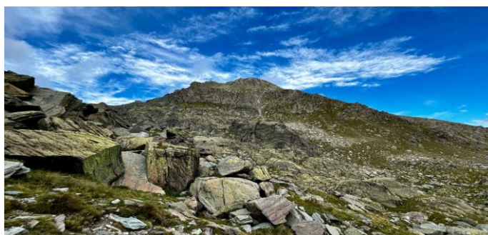
Il Monte Bego