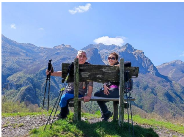
La panchina del Monte Rovaio