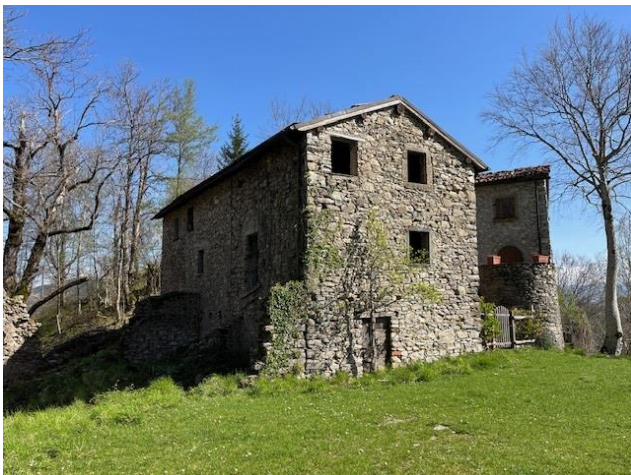
Casa Maraini a Pasquigliora