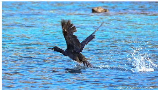
(Marangone dal Ciuffo in decollo)

Il comfort di un albergo. Ti offriamo una struttura ricettiva moderna e confortevole in cui scoprire un nuovo modo di fare vacanza. Il resto lo regala l'isola, con i suoi idilliaci paesaggi. Escursioni, trekking, aperitivi al profumo di mare: Capraia è l'isola che cercavi per staccare la spina. E c'è una sola regola: vivere a pieno il TUO tempo. Tutto il meglio per farti godere la tua avventura: giardino naturale e selvaggio a picco sul mare e piscina sono i plus da