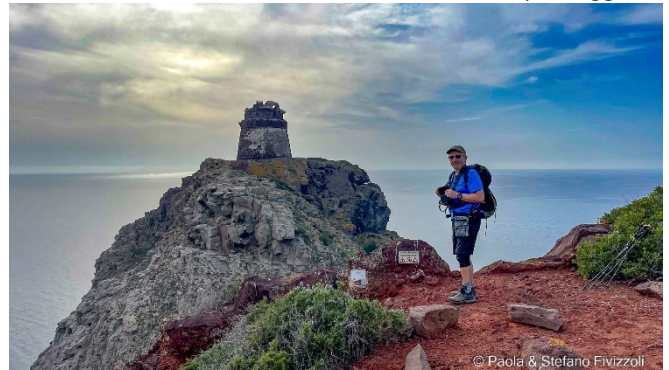
(Torre dello Zenòbito – Termine percorso escursionistico)

il comfort di un albergo. Ti offriamo una struttura ricettiva moderna e confortevole in cui scoprire un nuovo modo di fare vacanza. Il resto lo regala l'isola, con i suoi idilliaci paesaggi. Escursioni, trekking, aperitivi al profumo di mare: Capraia è l'isola che cercavi per staccare la spina. E c'è una sola regola: vivere a pieno il TUO tempo. Tutto il meglio per farti godere la tua avventura: giardino naturale e selvaggio a picco sul mare e piscina sono i plus da non perdere. Troverai tutti i servizi necessari per vivere appieno le meraviglie di Capraia." (Dal Sito Internet dell'HOSTEL).