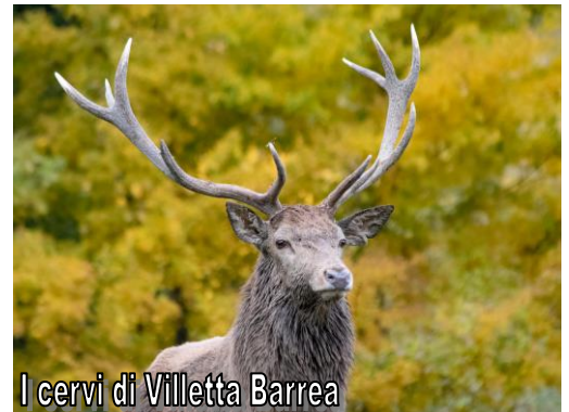
I cervi di Villetta Barrea

grave stato di degrado a causa di terremoti e attacchi; fu ricostruita nella zona superiore al margine di pietra, e fu fortificata con una cinta a tronco di piramide con torri angolari a scarpa. Durante il Medioevo, attorno alla torre si sviluppò il borgo