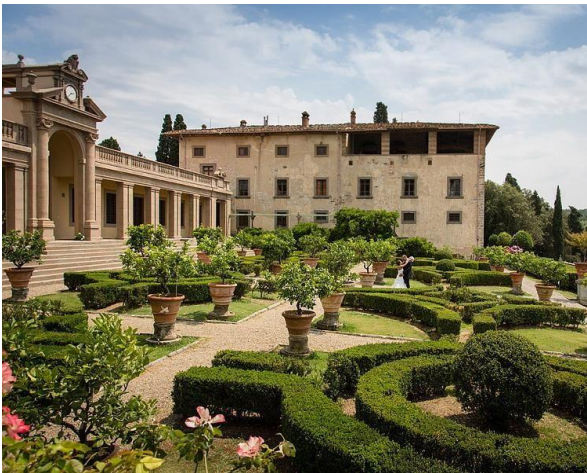
Villa Caruso di Bellosguardo