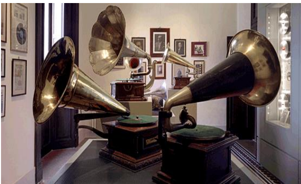
Museo Enrico Caruso

Per questa 3° escursione "cittadina" utilizziamo il sentiero 742, un percorso ad anello recentemente rivisto e segnalato dalla nostra Sezione di Firenze.